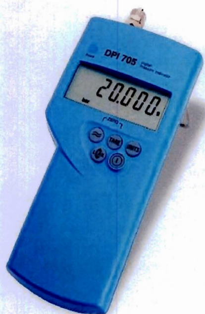
Рисунок 2 - Общий вид приборов цифровых для измерения давления DPI 705, DPI 705 IS, DPI 740

Пломбировка приборов цифровых для измерения давления DPI 104, DPI 104 IS, DPI 705, DPI 705 IS, DPI 740 от несанкционированного доступа не предусматривается.