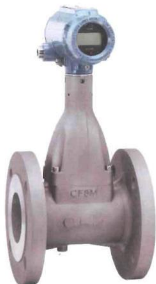
а) интегральное исполнение